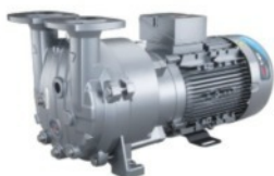
Pompe per Vuoto ad Anello Liquido e Compressori

Serie V - Pompe a palette rotative, sia a secco che lubrificate a olio, leader nel settore, progettate per applicazioni industriali di vuoto e compressione.