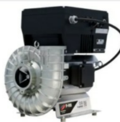
Radial Compressors, Fans & Vacuum Pumps

S-Serie - Soluzioni per vuoto senza olio e senza contatto, progettate per precisione e prestazioni industriali.