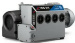
Pompe per vuoto e compressori a palette rotative

G-Serie - Soluzioni affidabili ed efficienti per vuoto e compressione per applicazioni industriali.