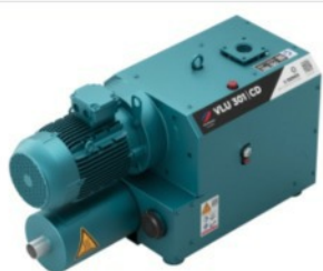
Pompe per vuoto a secco a artiglio e compressori

RIMA è partner ELMO Rietschle e oltre alla fornitura di nuovi sistemi offriamo assistenza per la manutenzione ordinaria e straordinaria con parti originali e la competenza dei nostri tecnici.