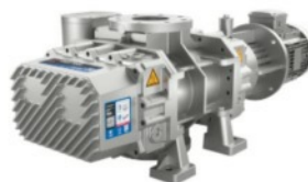
Pompa per vuoto a lobi rotanti R-VWP

Serie L - Progettata per processi umidi, offre affidabilità e durata senza pari per diverse applicazioni industriali.