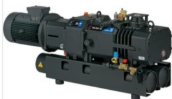
Pompe per vuoto a vite secca

Serie C - Vuoto e aria compressa a secco e senza contatto per applicazioni industriali