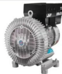
Soffianti a Canale Laterale

Radial fans are mainly used in the packaging and paper industries, with the smaller units used for extracting dust with fine material such as paper powder